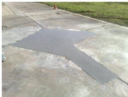
Reparación con material elastomérico