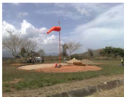
Manga de Viento pista 28