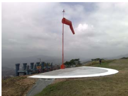
Manga de Viento pista 10

Se construyó una losa a su alrededor para facilitar la demarcación de acuerdo a las Regulaciones Aeronáuticas Venezolanas. Actualmente se completan los trabajos respectivos en la manga de viento de la pista 28. El objetivo es hacerlas más visibles para las aeronaves en vuelo en las inmediaciones del aeropuerto.